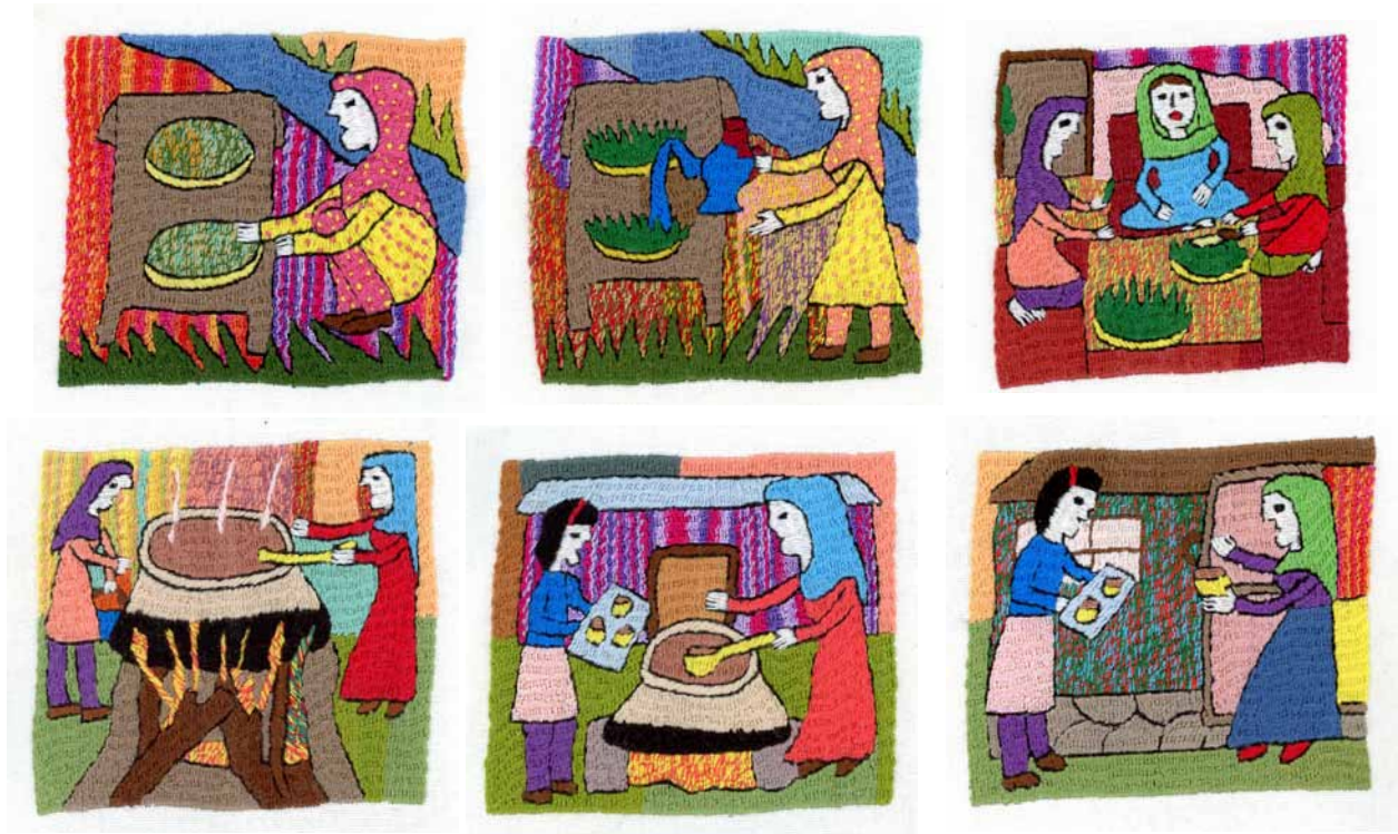
Samanak-préparation pas à pas – brodé de Meshgan

Ramadan ou encore Ramazan, comme l'appelle les Afghans, a commencé. Les brodeuses seront moins actives pendant ce temps particulier, synonyme de moins d'énergie pendant les journées. Mais il est sûr, d'ici le prochain voyage en juillet, qu'elles auront encore produit de superbes broderies qui nous raviront par leurs couleurs et leurs idées.