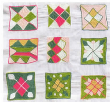
Quelques carrés de Majan