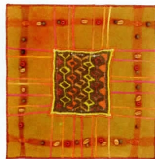
Miniatures de Monika Sebert