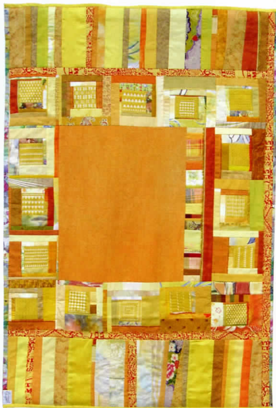
Tapis d'enfant jaune, Pascale Goldenberg

Pour ces nombreuses pièces réalisées collectivement à Fribourg par une petite équipe de femmes dynamiques et engagées, c'est toujours la pratique du recyclage qui a guidé le travail. Par respect pour ces femmes afghanes vivant de très peu, il nous est inconcevable d'investir dans des tissus nouveaux pour mettre leurs carrés en valeur. Ces pièces servent à présenter le projet et à donner envie d'acheter des carrés, pour se mettre soi-même à l'ouvrage.