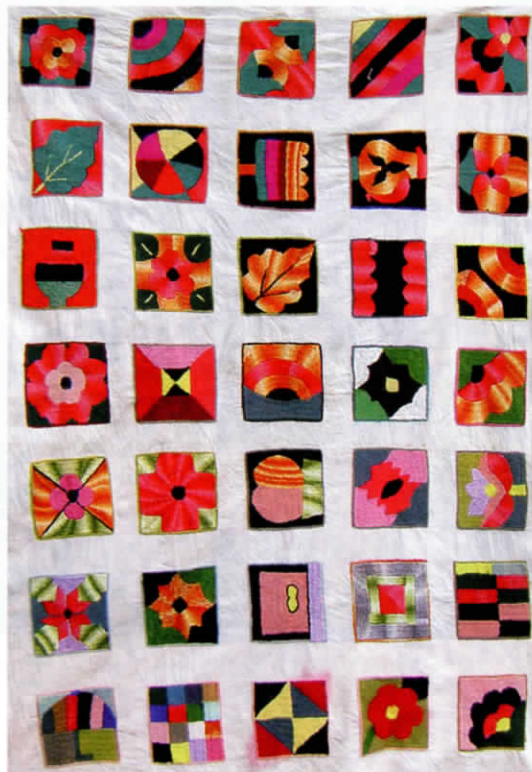
Drap brodé par Schafiga

Les femmes brodent sur des draps des carrés de 8 cm de côté. Chacune est encouragée à trouver son style personnel, et cette petite surface peut être le support d'une véritable improvisation. Elles sont totalement libres de composer leurs propres motifs qui, le plus souvent, reprennent, combinent et arrangent des motifs traditionnels comme ceux, graphiques et fins, de la broderie Kandahar ou ceux, floraux et très colorés, des tentures suzani . Selon leurs goûts, elles utilisent une seule ou plusieurs couleurs. Certaines sont capables d'improviser des motifs très personnels, où le carré est une véritable composition artistique. A titre d'exemple, les draps brodés de Majan et Simingol ont été travaillés avec la même palette de fils mais chacune a su trouver son style de broderie personnel.