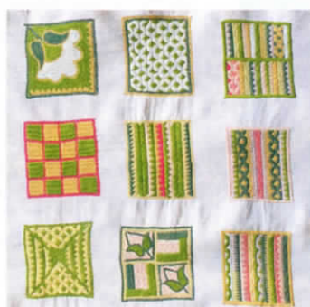
... et de Simingol